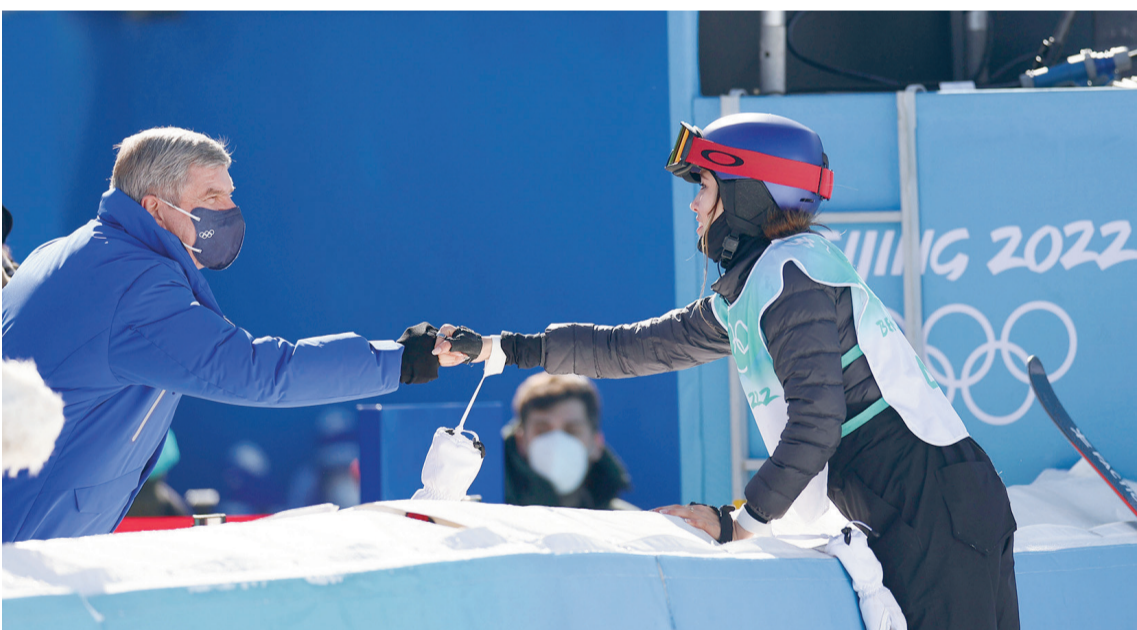
2月8日，国际奥委会主席巴赫（左）向中国选手谷爱凌表示祝贺。当日，在北京首钢滑雪大跳台举行的北京2022年冬奥会自由式滑雪女子大跳台决赛中，中国选手谷爱凌夺得冠军。