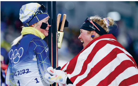
2月8日，冠军瑞典选手约娜·松德林（左）在赛后。当日，在国家越野滑雪中心举行的北京2022年冬奥会越野滑雪女子个人短距离（自由技术）决赛中，瑞典选手约娜·松德林夺冠。