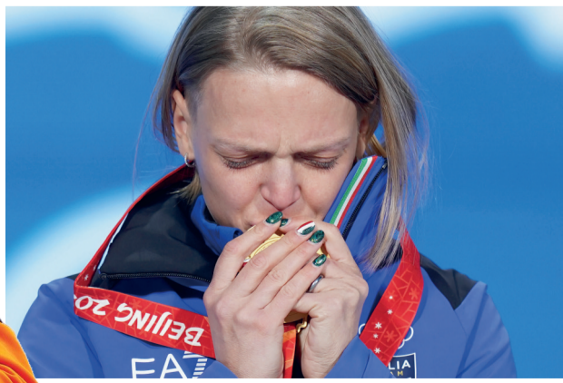
2月8日，冠军意大利选手阿里安娜·方塔纳在颁奖仪式上亲吻金牌。当日，北京2022年冬奥会短道速滑女子500米奖牌颁发仪式在北京颁奖广场举行。